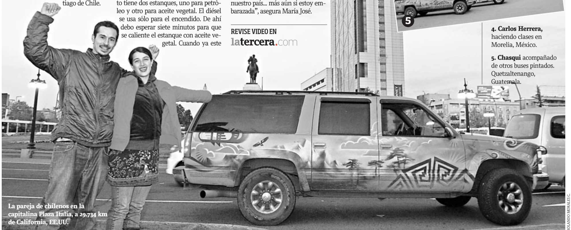
La pareja de chilenos en la capitalina Plaza Italia, a 29.734 km de California, EE.UU.