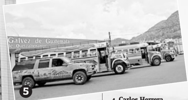
5. Chasqui acompañado de otros buses pintados. Quetzaltenango, Guatemala.